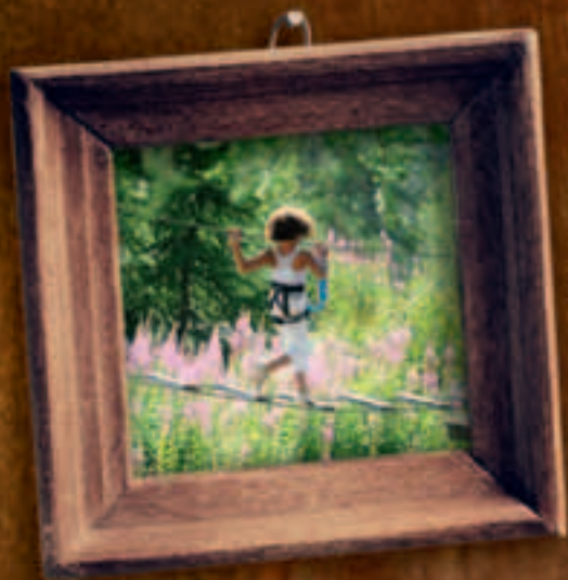
Marius au parcours aventure de Risoul