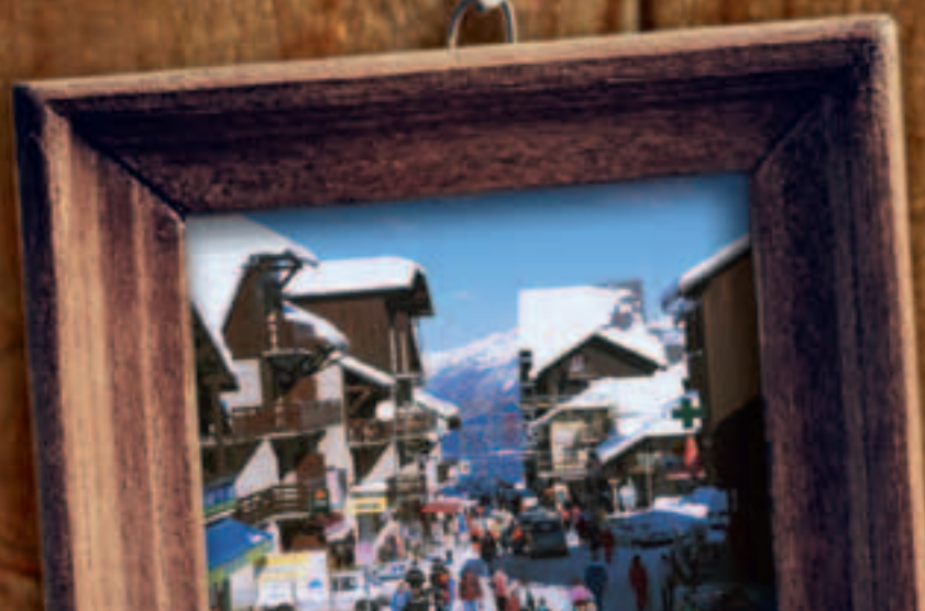
La rue principale de Risoul toujours animée, aux senteurs et aux couleurs de marché