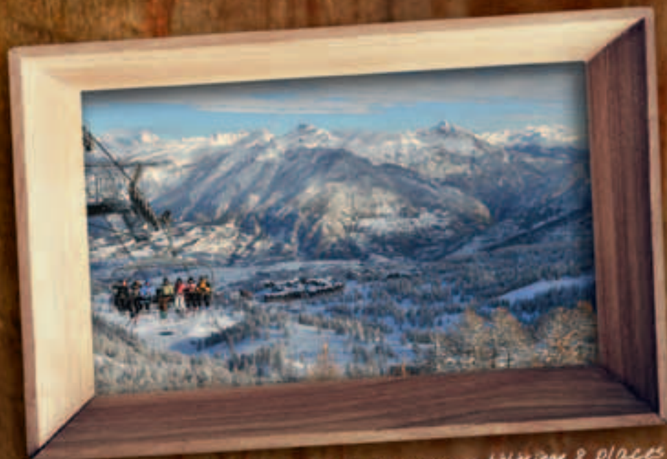
On avait jamais vu un télésiège 8 places