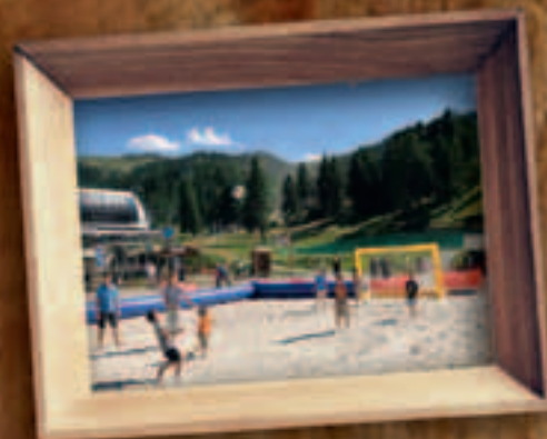
Les sports de plage à la montagne : pas banal !