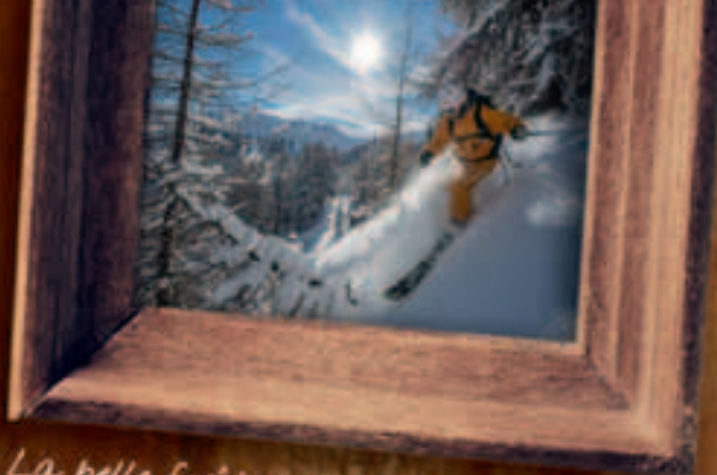
La belle forêt de mélèzes sous le soleil de Risoul : un théâtre de rêve et des souvenirs inoubliables